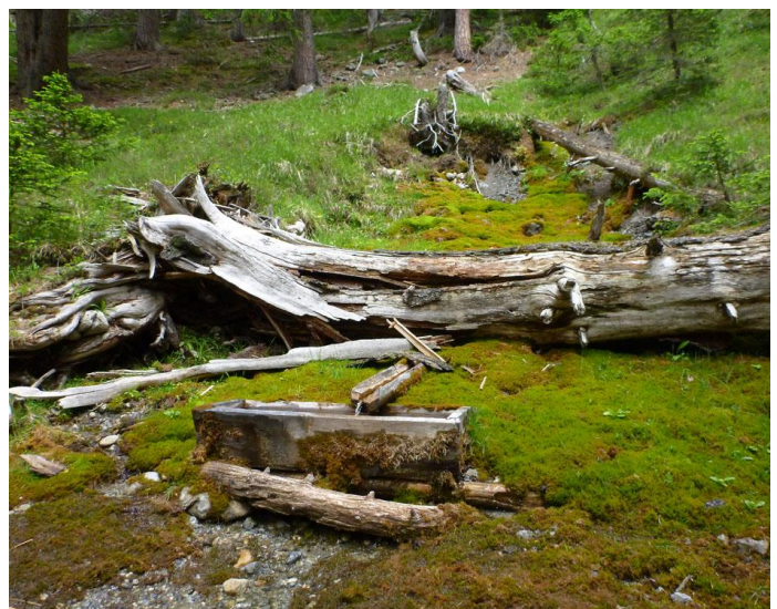
Eine Quelle im Nationalpark

Dort wo Wasser an die Erdoberfläche sprudelt befindet sich eine Quelle. Sie steht am Übergang zwischen Grundwasser und Oberflächenwasser und bildet streng genommen kein eigenes Gewässer wie einen See oder einen Bach. Trotzdem beherbergen Quellen eine einzigartige und oftmals artenreiche Lebensgemeinschaft, die in anderen Gewässern nicht leben kann. Der Vortrag stellt diesen noch viel zu wenig bekannten und erforschten Lebensraum vor und zeigt welche Strategien Kleintiere entwickelt haben um dort zu (über)leben. Quellen sind gefährdet. Sie stehen nicht nur als Trinkwasserspender unter hohem Nutzungsdruck. In den Alpen setzt ihnen auch die Klimaerwärmung zu. Grund genug ihnen mehr Beachtung zu schenken!