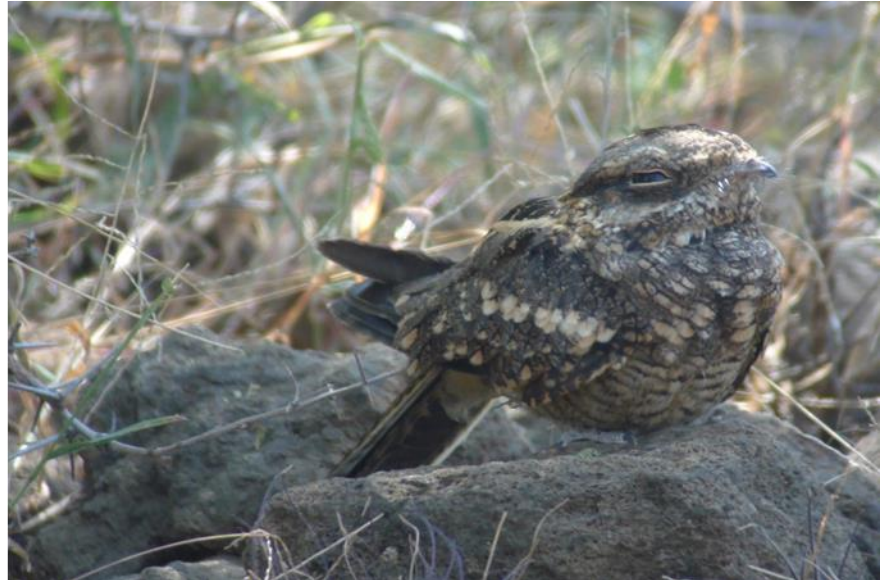
Slender-tailed Nightjar

Weiter ging's zu einem Baum, wo wir ein schlafendes Zwergohreulenpaar (African Scopes-Owl) ausmachen konnten. Darauf führte uns Wilson zielstrebig in ein Tobel und zeigte uns in einer Felsspalte zwei Grau-Uhus (Greyish Eagle Owl), welche ausschliesslich in Afrika vorkommen. Wir eilten zu unserem letzten Beobachtungsziel, als endlich die Dämmerung hereinbrach. In Minutenschnelle, hatten wir wiederum bildfüllend zwei Perl-Sperlingskäuze (Pearl-Spotted Owlet), die afrikanische Ausgabe des Sperlingkauzes in unserem Spektiv. Schon früher habe ich schlafende Eulen gesehen, – aber noch nie an einem sonnigen Nachmittag – das ist ein Rekord für sich und ein echter Beweis für das enorm grosse einheimische Wissen meiner Guides!