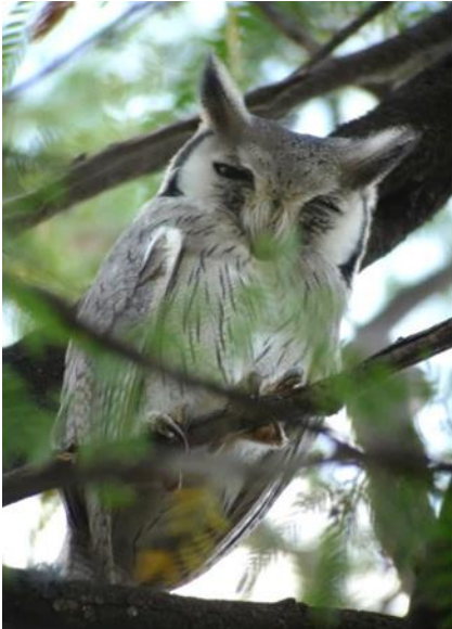
Northern White-faced Owl

Nach einem weiteren Kilometer führte er uns plötzlich schweigend ins Dickicht. „Hier“, sagte er und innerhalb einer Minute entdeckten wir auf dem steinigen Boden eine perfekt getarnte Kurzschleppen Nachtschwalbe (Slender-tailed Nightjar). „Der Vogel brütet hier, ich habe ihn vor einiger Zeit entdeckt“, bemerkte Wilson. Eine Eule und eine Nachtschwalbe, ich schüttelte nur verwundert den Kopf.