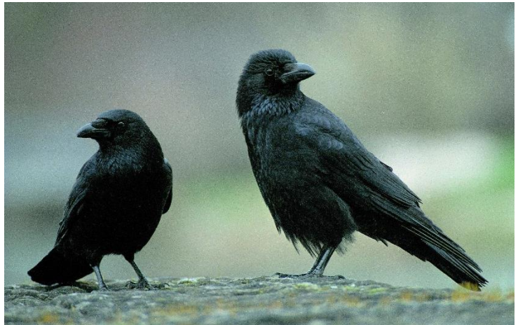
Paar der Rabenkrähe