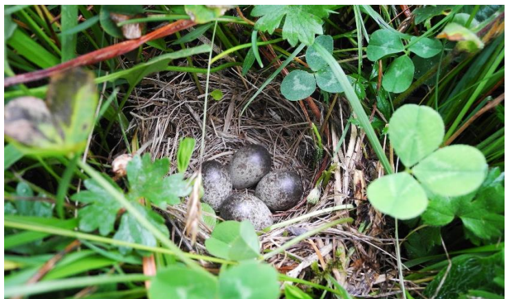
Bild oben: Blick in das Boden-Nest einer Feldlerche im Naturpark Beverin. Bild unten: Feldlerche in einer artenreichen Wiese im Naturpark Beverin.

Im Gebiet vom Naturpark Beverin hat die Vogelwarte Sempach erfreuliche Bestände von wiesenbrütenden Vögeln festgestellt, insbesondere auch der Feldlerche. Um mehr Grundlagen zum Schutz der Feldlerche im alpinen Raum zu erarbeiten, wurde ein Forschungsprojekt über die alpine Feldlerche initiiert, mit Hauptuntersuchungsgebiet am oberen Schamserberg. Am Bildvortrag wird auf die fünf heimischen wiesenbrütenden Vogelarten und mögliche Schutzstrategien eingegangen, sowie auf die aktuellen Resultate des Feldlerchenforschungsprojektes.